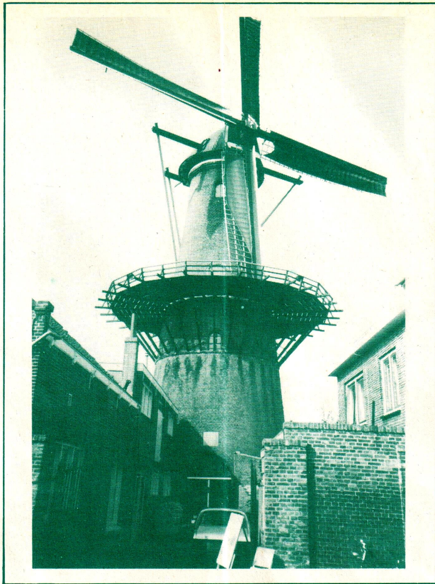
De gerestaureerde 'De Walvisch' in Schiedam