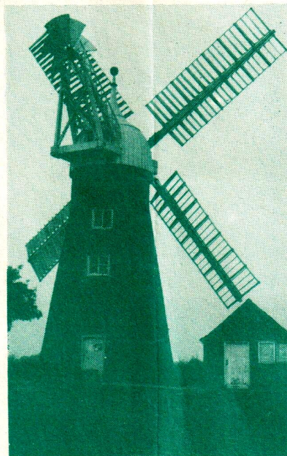
North Leverton. Deze nog altijd in bedrijf zijnde molen heeft een uitstekende windvang.